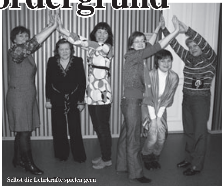
Selbst die Lehrkräfte spielen gern

ben, Funktionen der Journalistik und die Merkmale der nationalen Medien – auch mit Medien der Russlanddeutschen in Russland bekannt machen. Außerdem stellten sie die Notwendigkeit der Kooperation zwischen den deutschen Zentren und Massenmedien zur Diskussion und nahmen am journalistischen Praktikum teil. Daneben lernten die Seminarteilnehmer in der Praxis, welche Möglichkeiten es zur Präsentation der Tätigkeit und Veranstaltungen ihrer Zentren gibt.