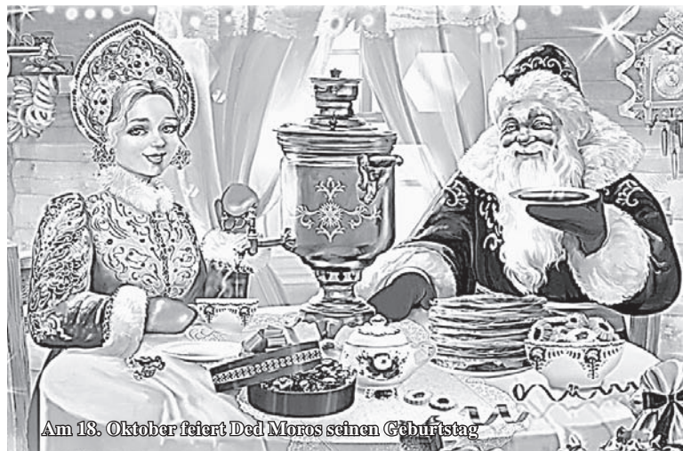
Am 18. Oktober feiert Ded Moros seinen Geburtstag

Die Assistenten des Ded Moros schenken ihm jedes Jahr einen neuen mit wunderschönen Stickereien verzierten Anzug. Von überall kommen seine vielen Verwandten – Santa Claus aus Finnland, Chiskhan aus Jakutien, Pakkaine aus Karelien, der winterliche Märchenerzähler Mikulasch aus Tschechien, Snegurotschka aus Kostroma als auch offizielle Delegationen aus Wologda, Moskau, Nishnij Nowgorod und vielen anderen Städten, um den Ded Moros zu gratulieren. Vielleicht schickst auch du mal eine Glückwunschkarte an den Ded Moros!