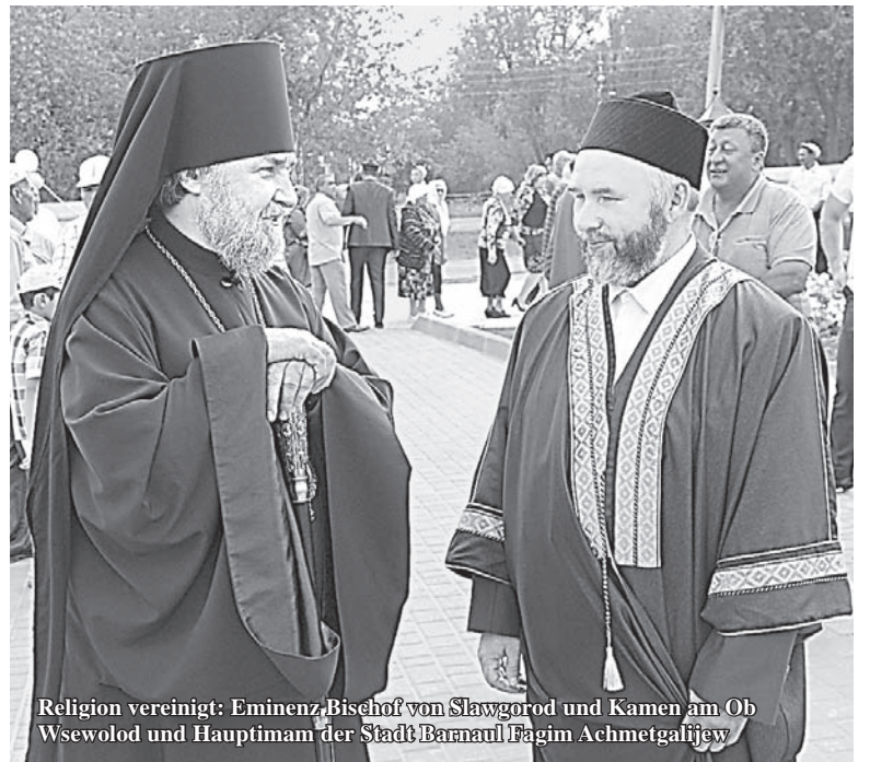
Religion vereint: Eminenz Bischof von Slawgorod und Kamen am Ob Wsewolod und Hauptimam der Stadt Barnaul Fagim Achmetgalijew

„Jedes Gotteshaus bringt dem Menschen Gott näher und mehrt die Heiligkeit auf der Erde. ... Die Priester und Mitglieder der Pfarrgemeinde der Slawgoroder Moschee sollen sich alle Mühe geben, um nicht nur einen zwischenreligiösen Dialog zu unterstützen, sondern auch um jegliche Konflikte und Extremismerscheinungen, die ihre wahre Ziele oft geschickt mit religiösen Losungen verdecken, nicht zuzulassen“, steht im Schreiben. Vitalij Snessarj brachte die Hoffnung zum Ausdruck, dass die geistliche Moslemverwaltung des Altai auch weiterhin eine umfangreiche geistlich-moralische und Aufklärungsarbeit unter den Mohammedanern der Region leisten wird. Außerdem unterstrich er die Wichtigkeit der Mithilfe dieser Organisation und ihrer erfolgreichen Kooperation mit staatlichen Institutionen und Ämtern in solchen Bereichen wie Bildung, Erziehung der jüngeren Generation und Unterstützung der Familie. All das letztendlich trägt zur Festigung des friedlichen Lebens, gutem Einvernehmen und zum Erhalt des historischen und kulturel-